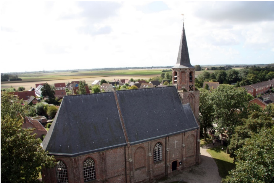
De Torenkerk (Gapinge)