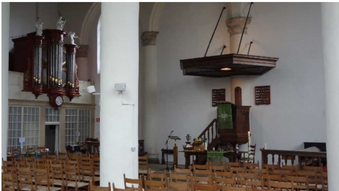
Interieur Kleine Kerk (Veere)

Dit programma wordt de gemeenteleden jaarlijks aangeboden in een programmaboekje genaamd: KerkXtra (bijgevoegd). Een selectie uit het programma wordt in het voor- en najaar, d.m.v. flyers, huis aan huis verspreid in de kernen van 'Vier!'.