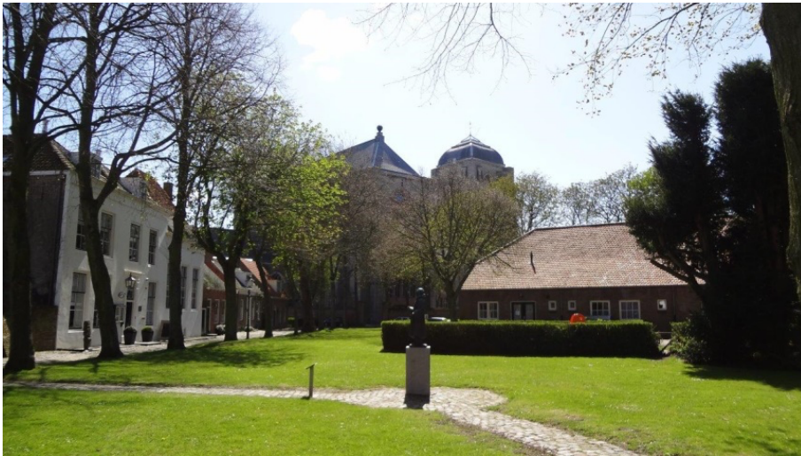
De 'Korenmaat' met op de achtergrond de Kleine- en Grote Kerk (Veere)